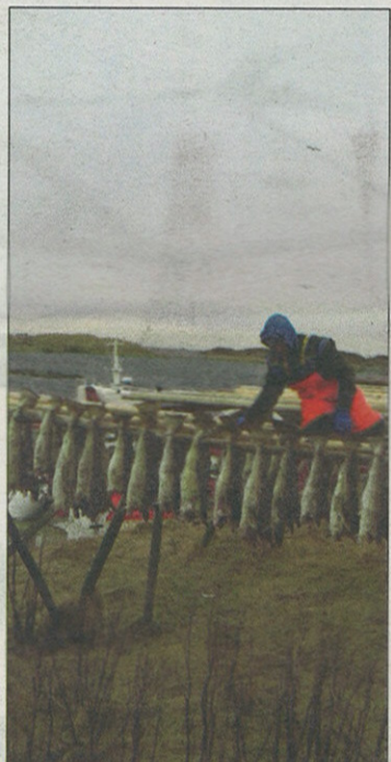
HENGING: Tørrfiskeindustrien er betydelig i Nord-Norge. Sperret fisk henges rund på fiskehjeller. Aktiviteten er særlig stor på Røst.